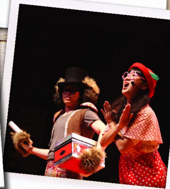
學校互動教育巡迴劇場