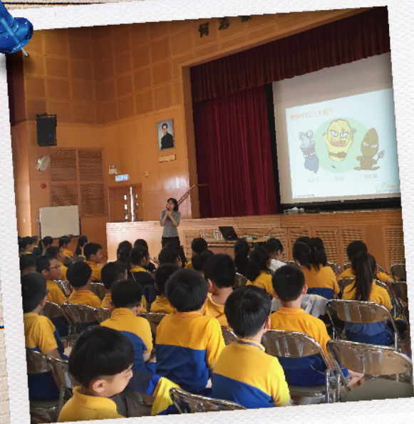
「無煙新世代」健康講座