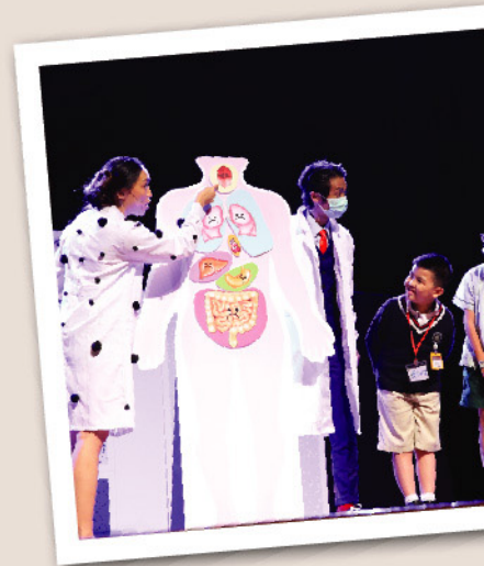
學生再次欣賞無煙劇場的意願